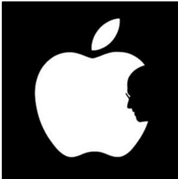
FIGUUR 3 Die Appel Logo

1.3.1 Pas TWEE eienskappe van 'n goeie logo toe op FIGUUR 3 hierbo om te wys of die logo suksesvol is of nie. (2)