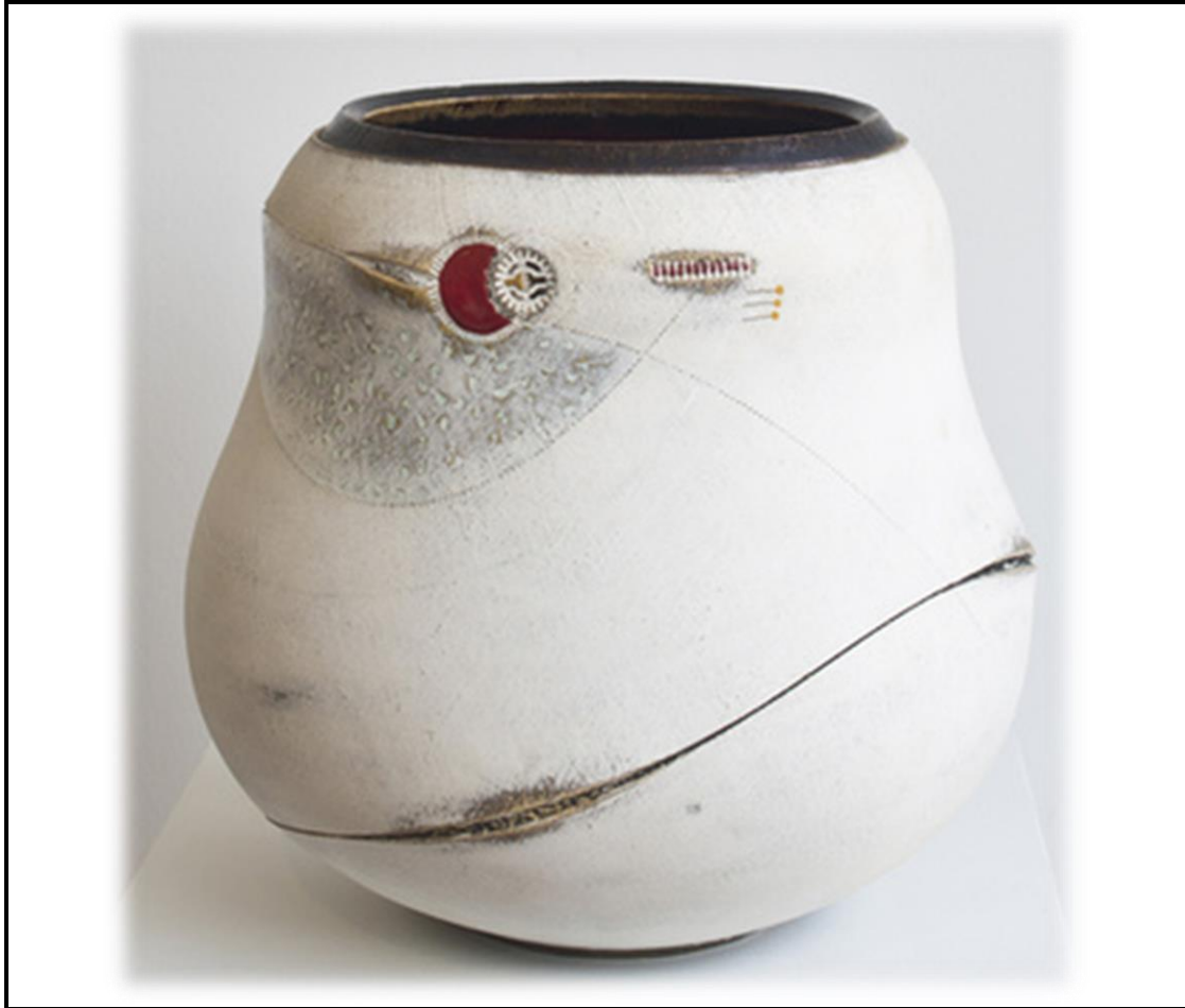
FIGUUR 1: 'Scarified Udu'-vaas deur Andile Dyalvane, Imiso Keramiek, Kaapstad.

1.1.1 Met verwysing na die keramiek vaas in FIGUUR 1 hierbo gesien ontleed enige VIER van die volgende terme: