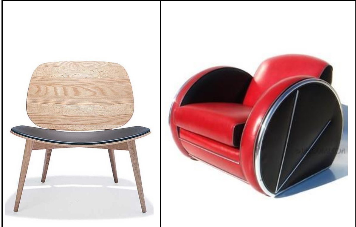
FIGUUR 1: Skandinawiese stoel.