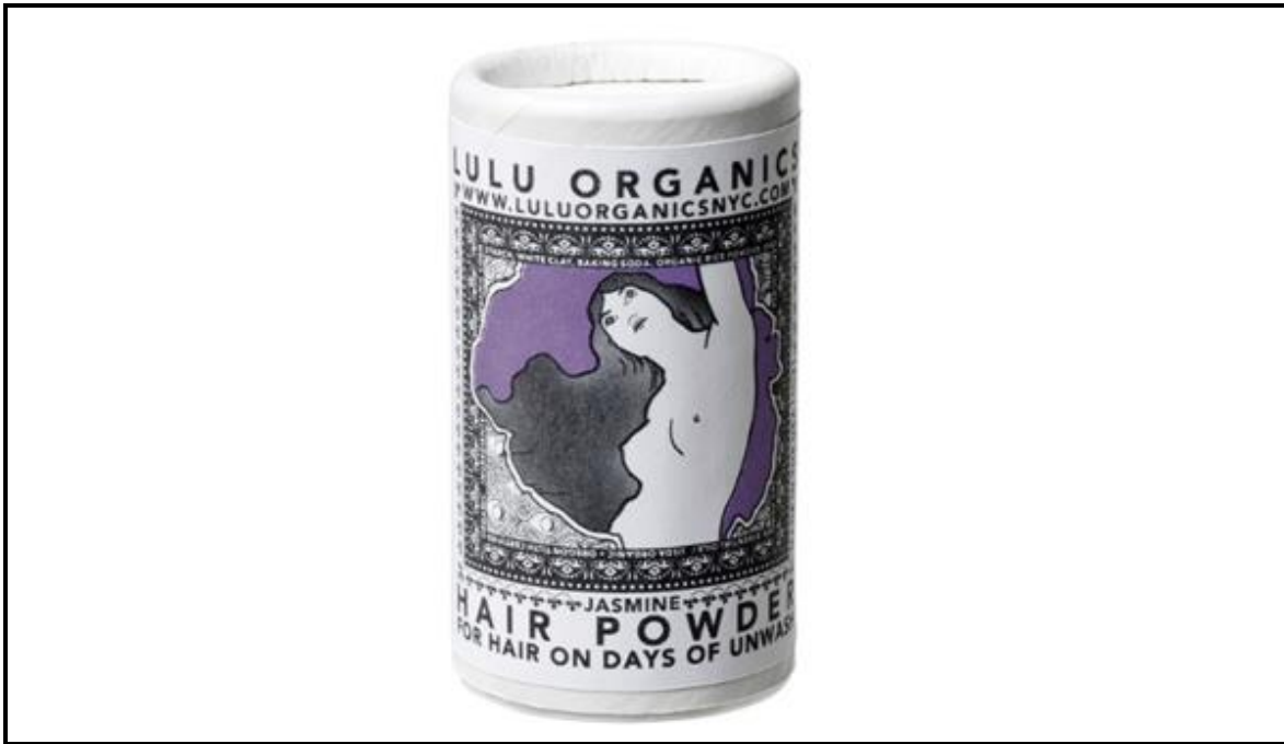
FIGUUR 3: Verpakkingsontwerp vir 'n haarproduk.