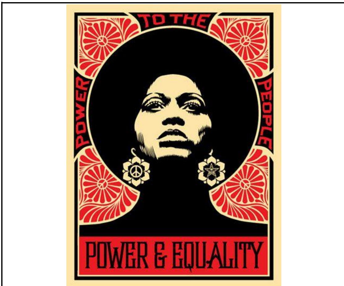
FIGUUR 4: Vroueregte plakkaat

Kies DRIE van die volgende terme met spesifieke verwysing na die plakkaatontwerp in FIGUUR 4 om jou begrip te verduidelik van: