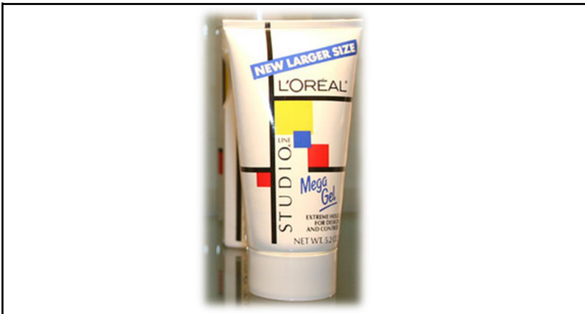
FIGUUR 4: Verpakkingsontwerp vir 'n haarproduk.

Die verpakkingsontwerp in FIGUUR 3 weerspieël invloede van Art Nouveau, en die verpakkingsontwerp wat in FIGUUR 4 weerspieël word toon invloede van die De Stijl beweging.