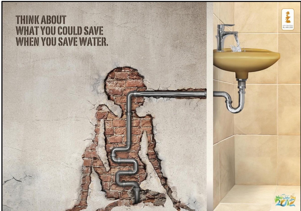
FIGUUR 2: Wêreld-Waterdag 2012 plakkaat deur Al Ain Zoo.

Met verwysing na FIGUUR 2 verduidelik hoe die plakkaat bewustheid skep van omgewings- en sosiale lewensomstandighede.