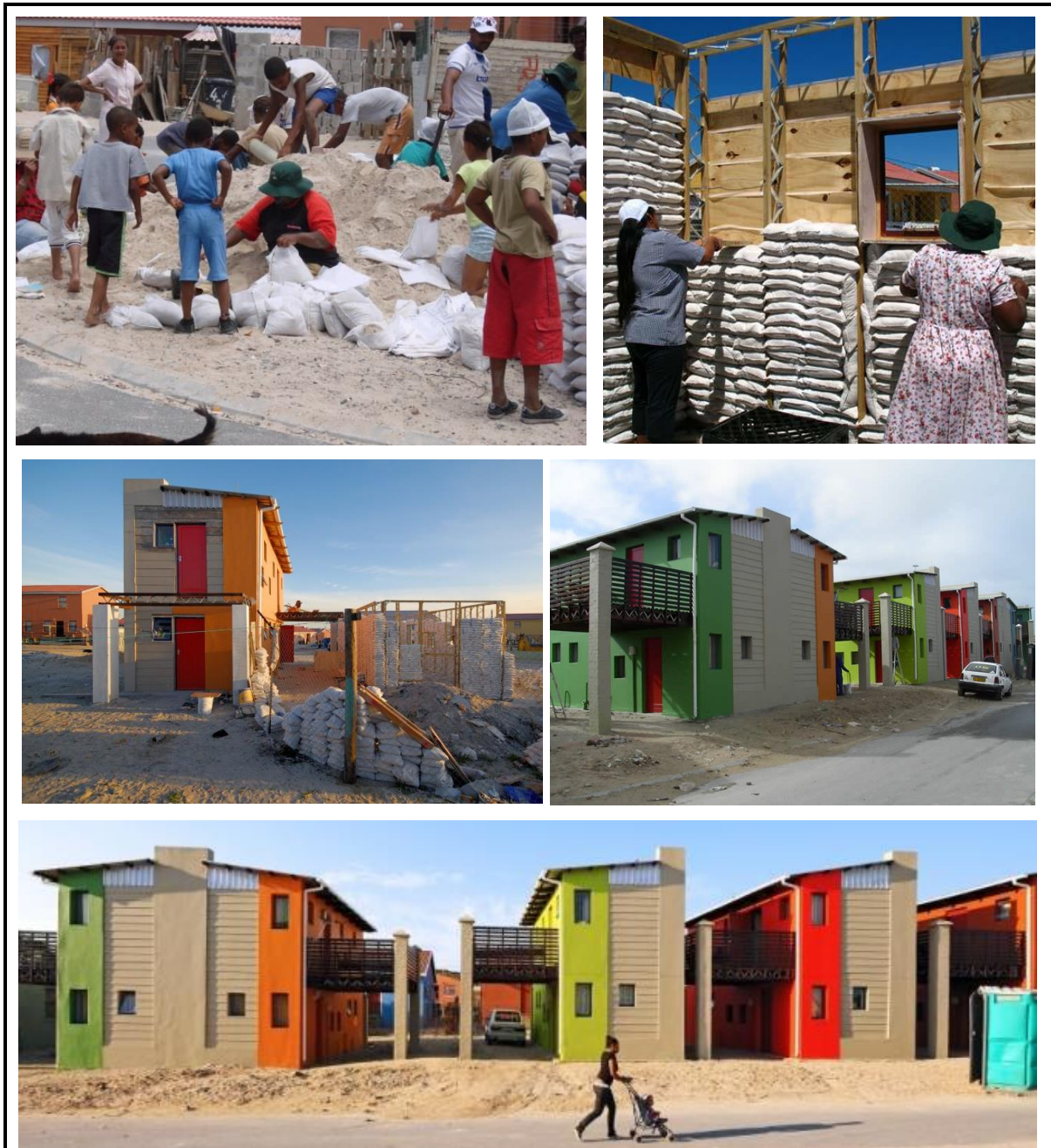
FIGUUR 1: 10x10 Laekoste behuising, 'Freedom Park' in Mitchellsplein, Kaapstad, deur MMA Argitekte.

10x10 Laekoste behuising is gebou deur gebruik te maak van plaaslike en goedkoop materiale. Die huise is gebou met die hulp van die 'Freedom Park' gemeenskap wat voorheen 'n informele nedersetting was. Elke huis kos R65 000, wat nuwe bekostigbare behuising verskaf in reaksie op stedelike armes. Die 'Ecobeams' stelsel van konstruksie vervang steen en mortel met sandsakke. Hierdie sandsakke was gevul met sand uit die duine en slegs 'n paar honderd meter van die konstruksierrein. Sonpanele is ook geïnstalleer.