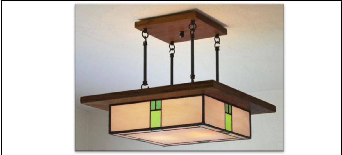
FIGUUR 5: Hangende lighouer deur Mission Studio, V.S.A.

Die hedendaagse lighouer in FIGUUR 5 word deur die Kuns en Kunsvlytstyl beïnvloed.