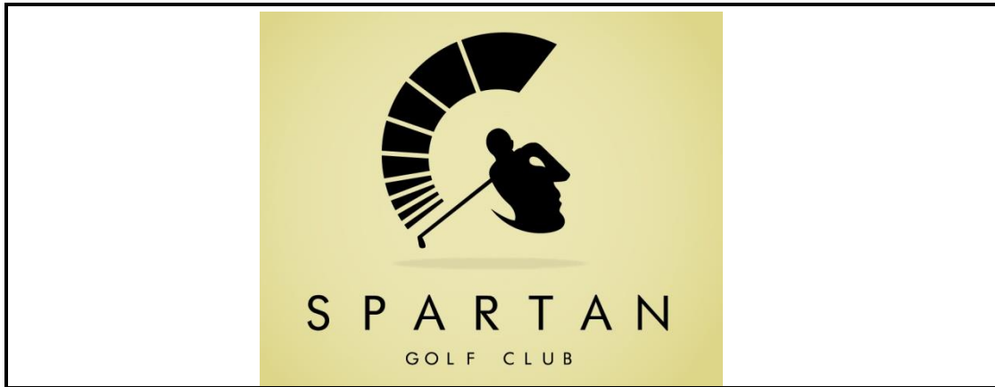
FIGUUR 3: Logo ontwerp

Die logo in FIGUUR 3 hierbo word gesien as 'n suksesvolle logo. Identifiseer TWEE Gestalt beginsels wat in die logo toegepas word en die manier waarop hul tot die sukses van die logo bydra.