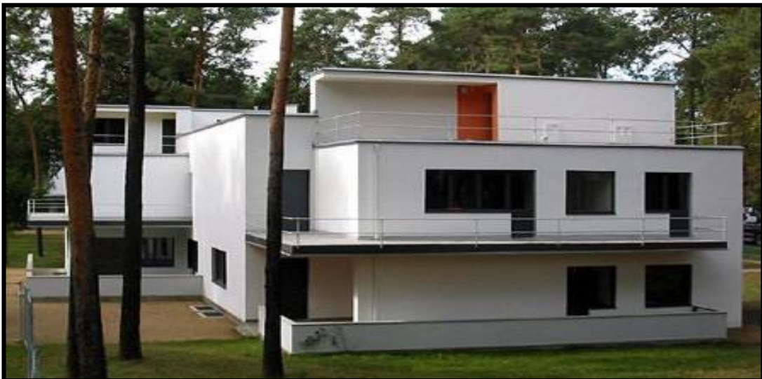
FIGUUR 2: Bauhaus Die Muche/Schlemmer Huis deur Walter Gropius en Marcel Breuer (Dessau, Duitsland), 1926. 'n "Meester se huis" vir die Bauhaus fakulteit.

2.1.1 Mies van der Rohe het gesê: "Argitektuur is die wil (wens) van 'n epog (n spesifieke tyd) wat in ruimte getransleer (vertaal) word."