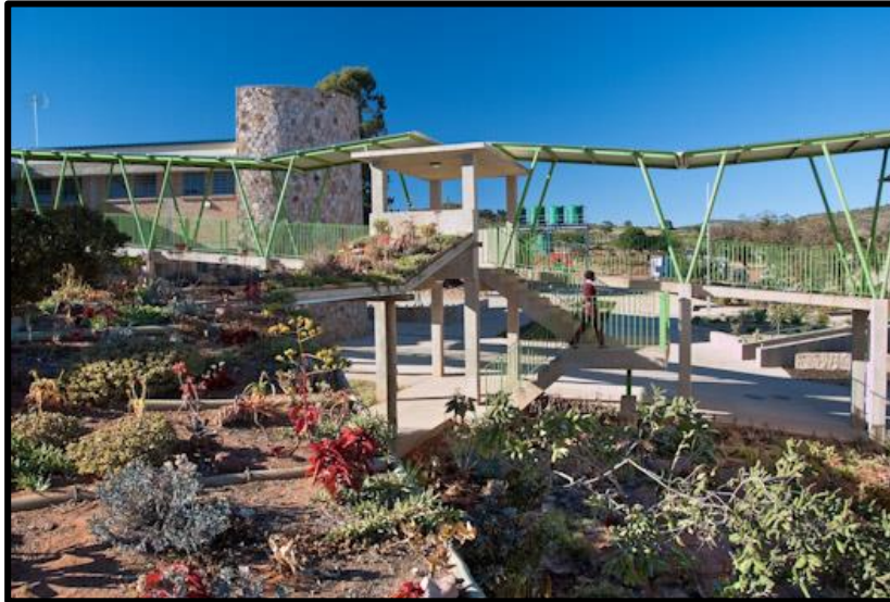
Vele Sekondêre Skool (Limpopo, Suid-Afrika), 2007–2011.

Herwonne energie in die vorm van sonkrag installasies worg gekombineer met 'n energie metersisteem en verskaf elektrisiteit aan 80 rekenaars.