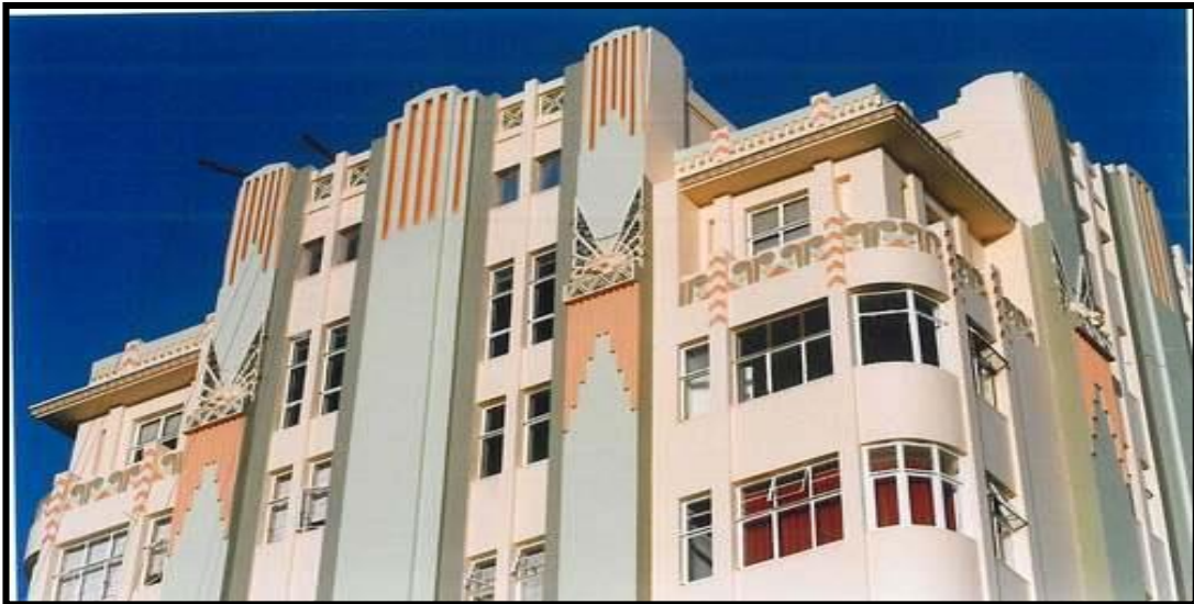
FIGUUR 1: Art Deco Surrey Mansions, Currey Straat (Durban, Suid-Afrika), 1932.