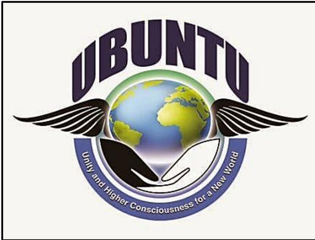
FIGUUR 5: Logo van die nuwe offisiële, globale UBUNTU Liberale Beweging. UBUNTU verwys na essensiële menslikheid waardes soos empatie en menslikheid.

1.4.1 Verduidelik wat jy verstaan van TWEE van die volgende aspekte met spesifieke verwysing na die logo in FIGUUR 3 hierbo: