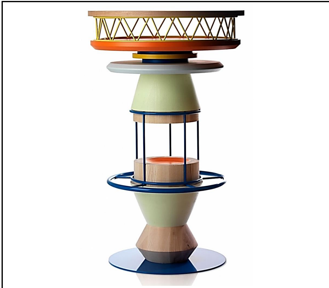
FIGUUR 1: 'Tembo' tafel deur Note Ontwerp-ateljee (Suid-Afrika), 2011.

'Tembo' beteken olifantvoet in Swahili. Dit is gemaak van gestapelde stukke hout, kurk en metaal.