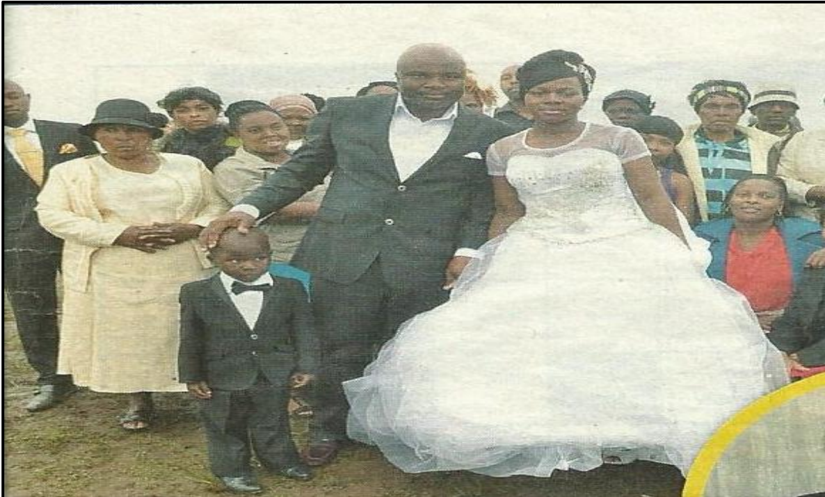
[E qotsitswe ho tswa ho: MOVE Pherekong 2014: 61]

Boha tema e latelang o nto araba dipotso tse thehilweng ho yona.