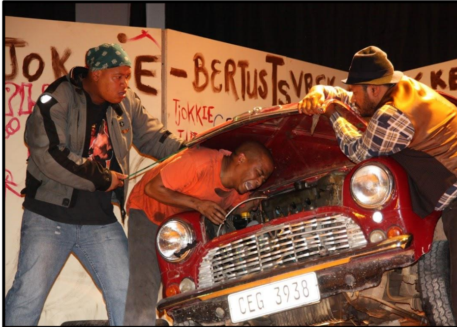
[ Siener in die Suburbs , 2010 deur PG du Plessis, regie deur GW Davids]