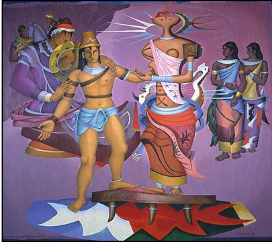
FIGUUR 2a: Alexis Preller, Primavera , olie op doek, 1965.