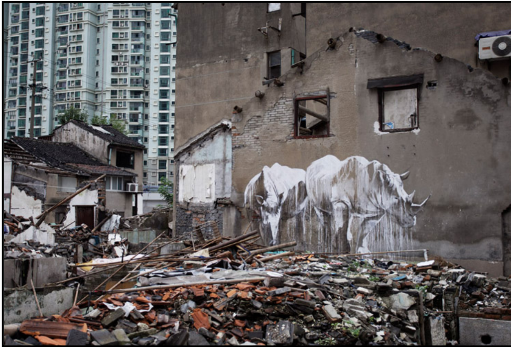
FIGUUR 5a: Faith 47, Taming of The Beasts (Tem van Die Ongediertes) , muurkuns, akrielverf en watervaste conté, Sjanghai, China, 2012.