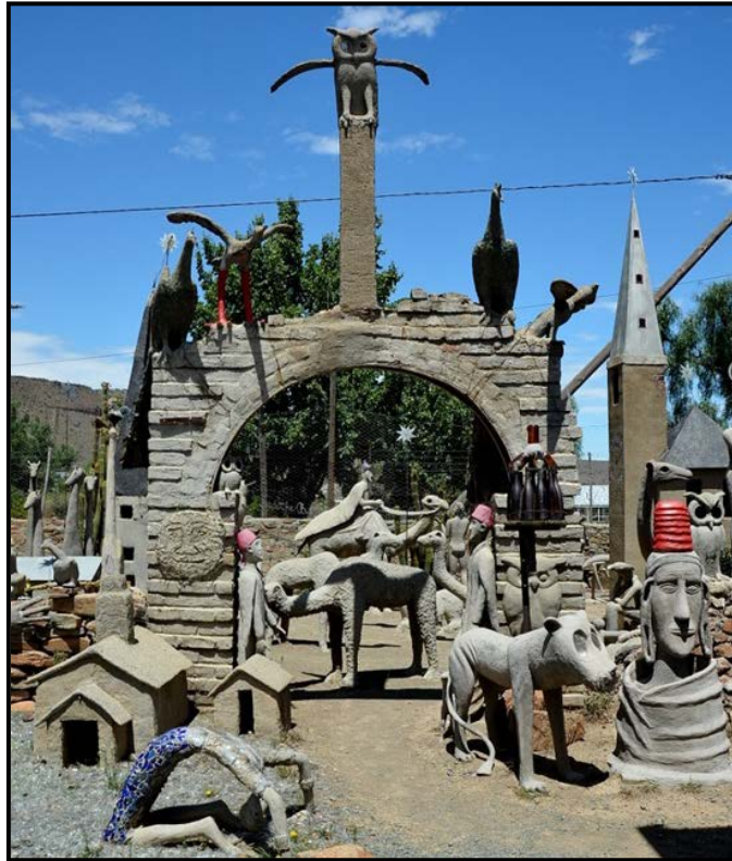
FIGUUR 4a: Helen Martins (1897–1976), Owl House (Uilhuis) , Nieu-Bethesda, sement, glas en draad.