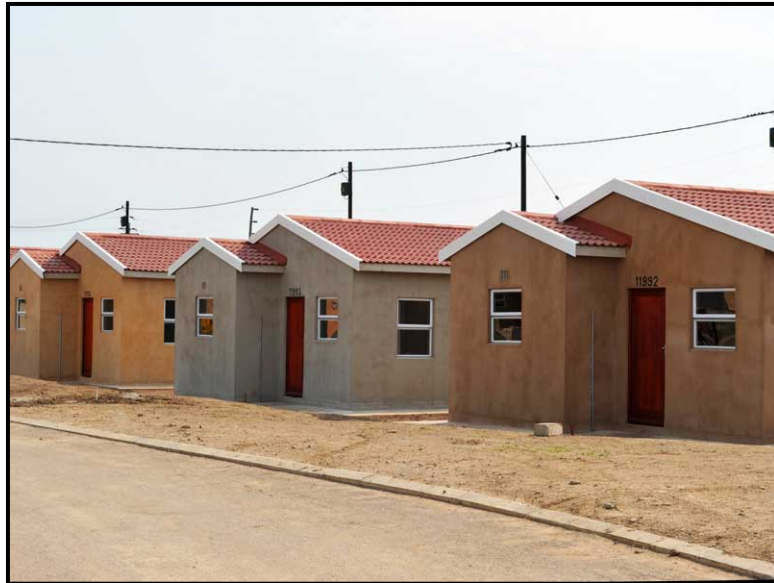
FIGUUR 8a: Heropbou- en Ontwikkelingsprogram, Suid-Afrika, in 1994 geïmplementeer.