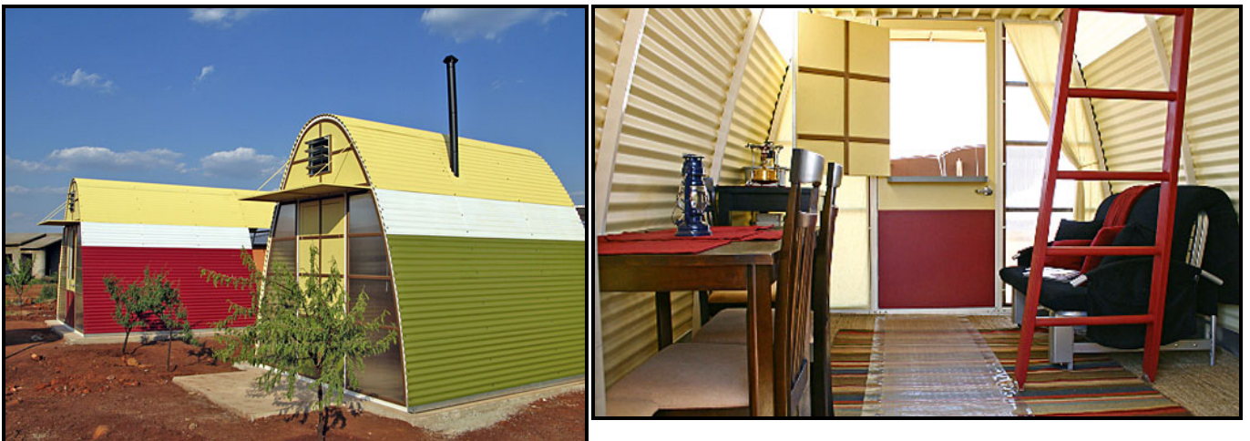
FIGUUR 8b: BSB Design, Architecture for A Change, (AFAC) (Argitektuur vir 'n Verandering) . Prototipe vir die gebruik van bekostigbare/mikro-behuising in Suid-Afrika, sonpanele, sinkplaat, glas, 2013. (Buite- en binne-aansigte)