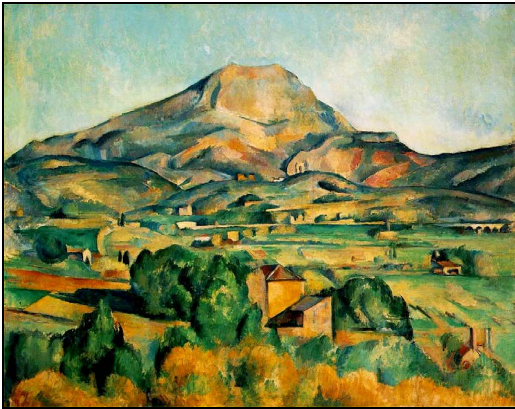
FIGUUR 1a: Paul Cézanne, Mont Sainte-Victoire Seen from Bellevue , ( Mont Sainte-Victoire Gesien vanaf Bellevue ), olie op doek, circa 1885.