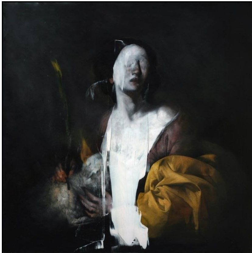
FIGUUR 7b: Nicola Samori, Agnese , olie op koper, 2009.