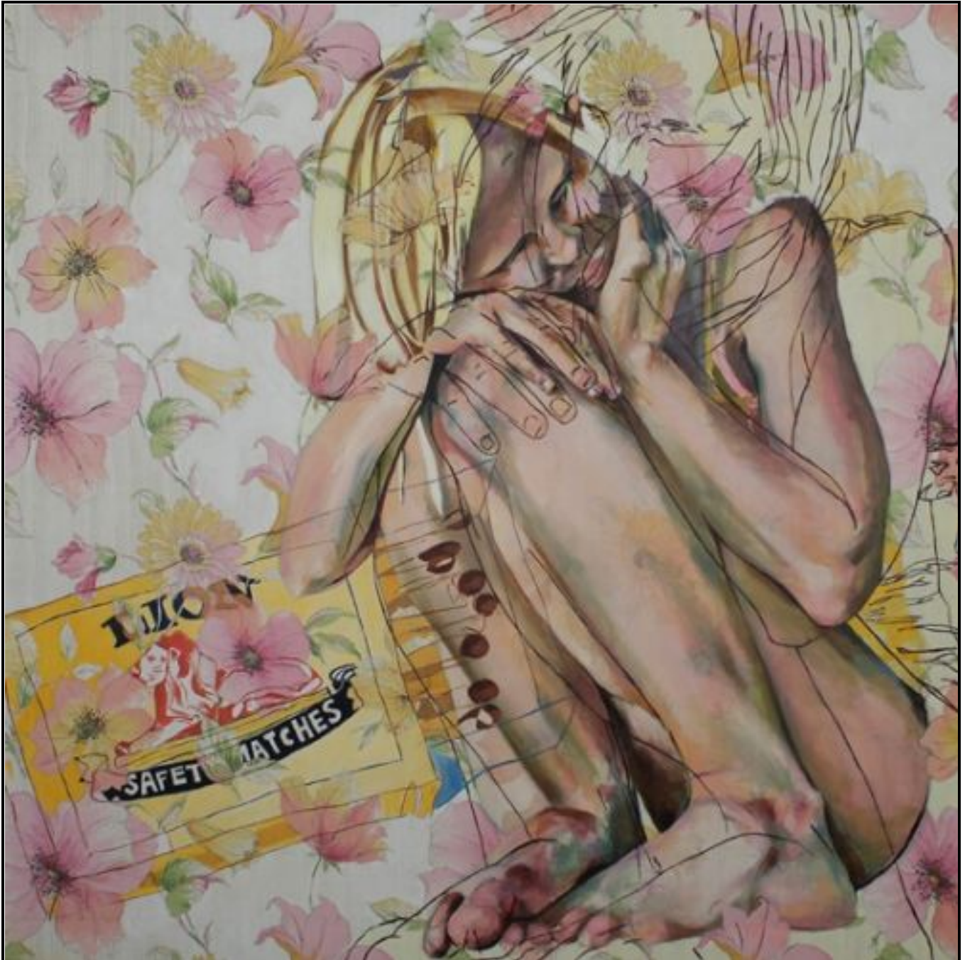
FIGUUR 6: Varenka Paschke, Safely Matched (Veilig Saamgevoeg) , akriëlverf, 2006.