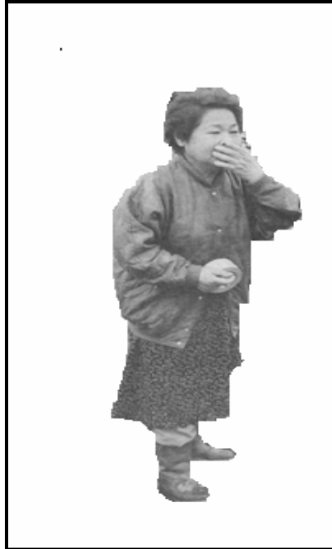
[Aangepas uit: Die Burger , Maart 2011]