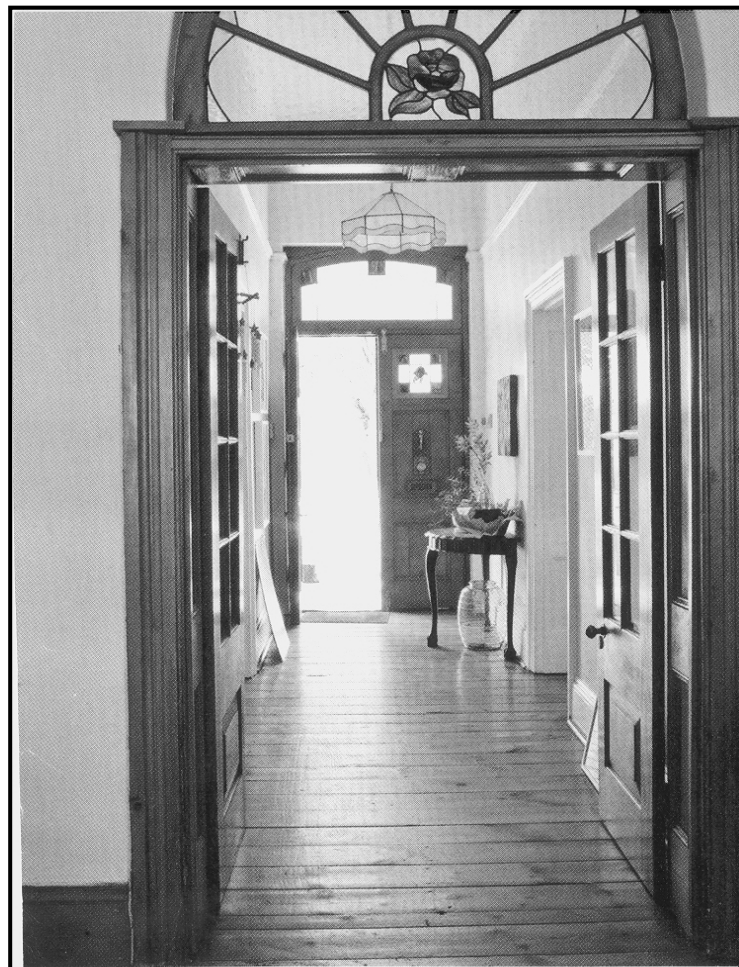
[Uit: Leef , Oktober 2010]