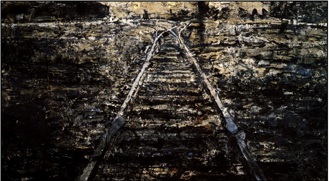
FIGUUR 3: Anselm Kiefer, Iron Road (Ysterpad) , olie, akriel, metaal en lood, olyftakke, yster en lood, 1986. Die treinspore wat na die Duitse konsentrasiekampe lei.

Landskap is die stille getuie van geskiedenis en stories.