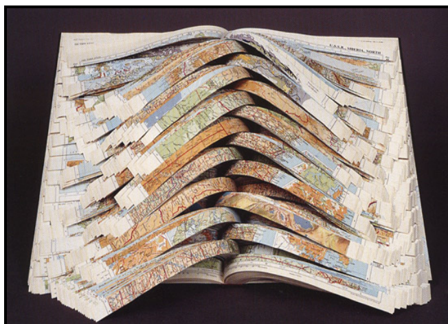
FIGUUR 9: Doug Beub, Fault lines (Verskuiwingslyne) , gewysigde atlaspapier, 2003.