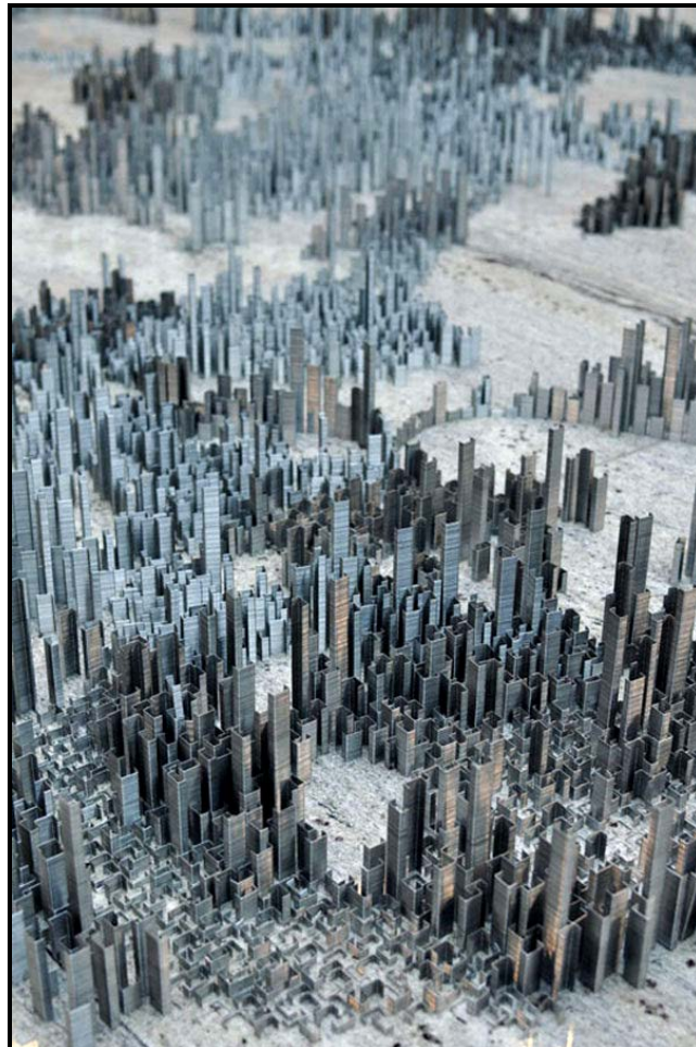
FIGUUR 8: Peter Root, Ephemicropolis , stad van krammetjiekuns, installasie wat bestaan uit 100 000 krammetjies, 2012.

Is 'n stedelike landskap dus maar net 'n landskap van 'n stad? Of is dit meer as dit?