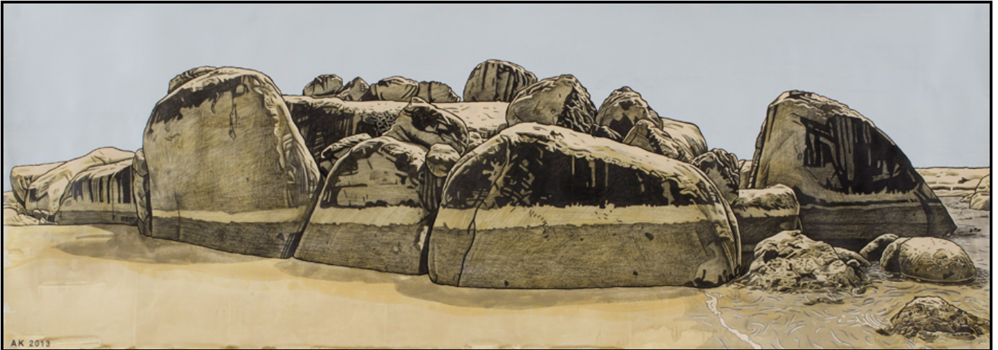
FIGUUR 2: Anton Kannemeyer, Boulders Beach, Simon's Town (Boulders-strand, Simonstad) , potlood, swart ink en akriel, 2013.