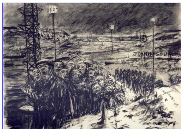
FIGUUR 7: William Kentridge, Johannesburg, 2 nd Greatest City after Paris (Johannesburg, 2 de Grootste Stad naas Parys) , houtskooltekening, 1989.

Drome is ons enigste aardrykskunde – ons geboorteland.