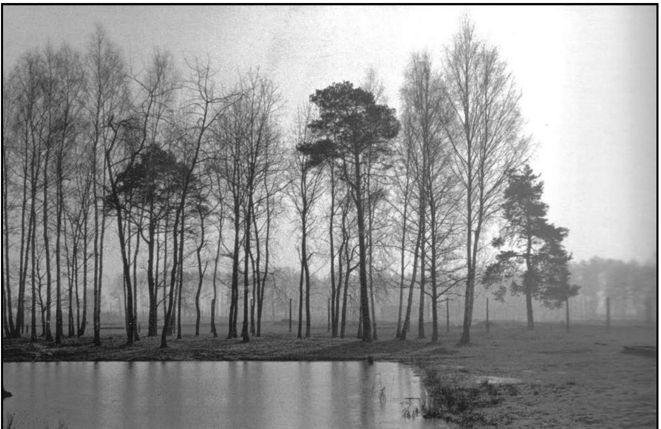
FIGUUR 4: Santu Mofokeng, Birkenau – KZ2, Poland (Pole) , foto, 1997–1998. Die meer waar Jode se as weggegooi is.