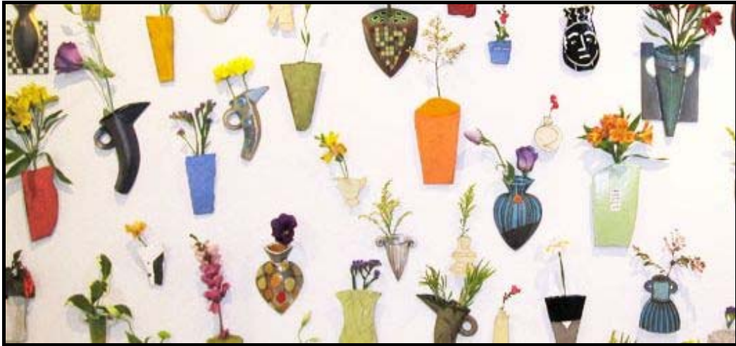
"Wall flower" by Die Indaba deur Clementina van der Walt en Hennie Meyer (2010)