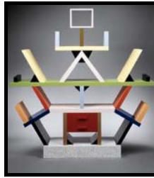
Ettore Sottass bv. Charlton Boekrak