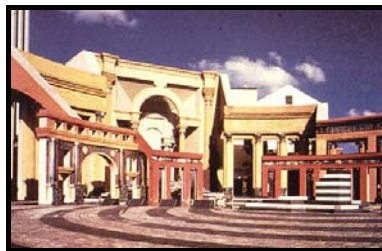
Charles Moore en sy " Piazza d' Italia "