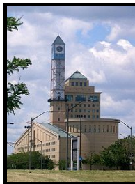
"Die Stadsaal in Mississauga", (Kanada)

Die wye landelike plaaskonteks het die struktuur van hierdie "futuristiese plaassaal" beïnvloed