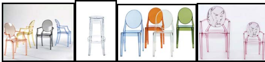
Phillipe Starck bv. "Ghost Chairs"